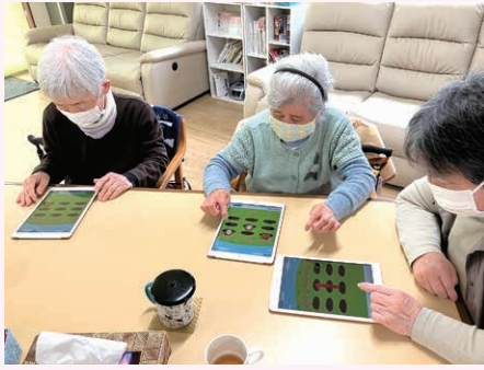
タブレットで「モグラたたきゲーム」を楽しむ利用者様たち

体験利用・見学を実施しています。 (体験利用は昼食代700円がかかります) まずはお問合せください。