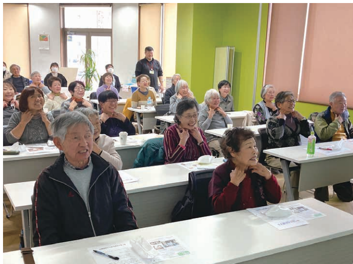
会場（虹の杜）の様子 あいうべ体操で口元の筋力アップ！

また、摂食嚥下治療は歯科医だけでなく様々な専門職が連携しながら行う必要があります。しかしながら全国的に見て歯科と医科の連携はまだ十分でない現状があります。