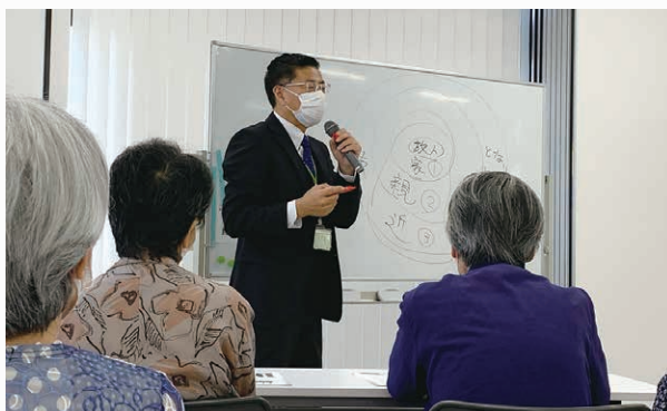
コープデリサービス 葬祭事業部から講師に来ていただきました

10月2日(月) コーププラザ宇都宮にて終活セミナーを開催しました。「終活について知りたい」「班会でエンディングノートをみんなで作りたいので、書き方を教わりたい」という組合員の要望から、とちぎコープにご協力をいただき、今回の学習会が実現しました。