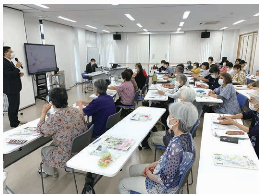
宗派の話や葬儀の積立など疑問が解決!

終活とは、人生の終わりに向かって、さまざまな準備をすることです。人生の終焉を考えることで、自分について振り返り「どのように生きていか」「残された人に望むことは何か」などが見えてきます。エンディングノートには、財産や保険、連絡先一覧のような情報だけではなく、もしもの時(不慮な事故や病気など)の希望や、大切な人へのメッセージなど、自分の想いを書き留められるようになっていきます。 参加した組合員は「エンディングノートを書く事で、頭の中で考えていたことが整理され、すっきりしました」「葬儀や遺産相続の事などを教えていただき、勉強になりました」と語りました。