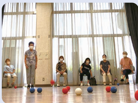
昨年度できた班会 ポッチャ宝会

地域で3人以上(組合員が1人でも)集まれば班会が開けます。ポッチャやモルックなどのゲームツールもあります。気軽にお問い合わせください。(地域活動部 028-600-1606)