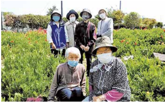
天気も良くお花見日和。みんなでポピーの花畑を楽しみました。