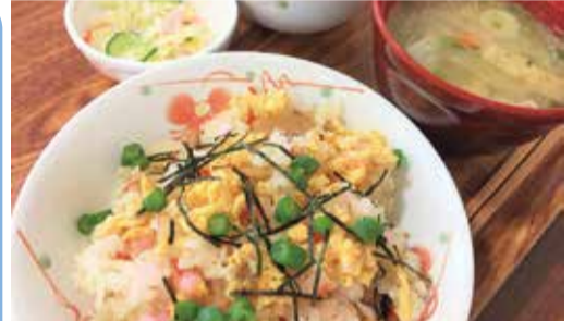
色どりもあざやかに