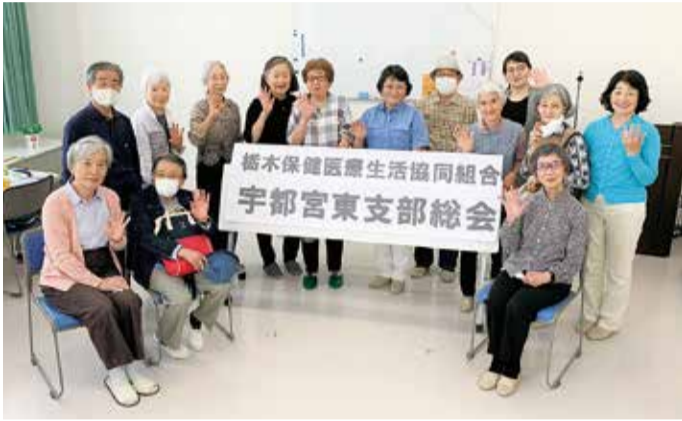
「医療生協の診療所が早く駅東にできるといいね」という意見が出されました。また、班会や支部の行事などに集まるのに、「車の乗り合いは難しくなっている」という話題から、日常生活を支える「足」を支援する仕組みづくりを考えることになりました。