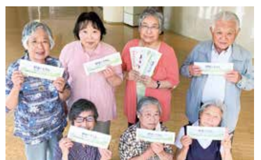
手配り仲間募集中!!

「健康とくらし」は毎月全組合員にお届けしています。郵送だけでなく、多くの組合員さんがボランティアで手配り配布してくれています。「日課のウォーキングついでに続けていますよ」という方も。