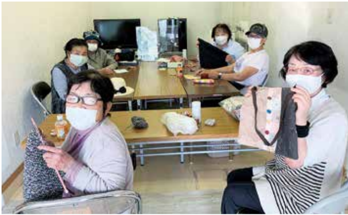
新ニコニコはうすで作品作りをしています。作品を持ち寄りアドバイスなど合せて楽しんでいます。