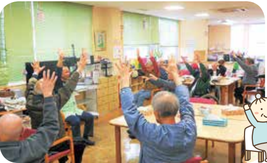
みんなで元気に体操