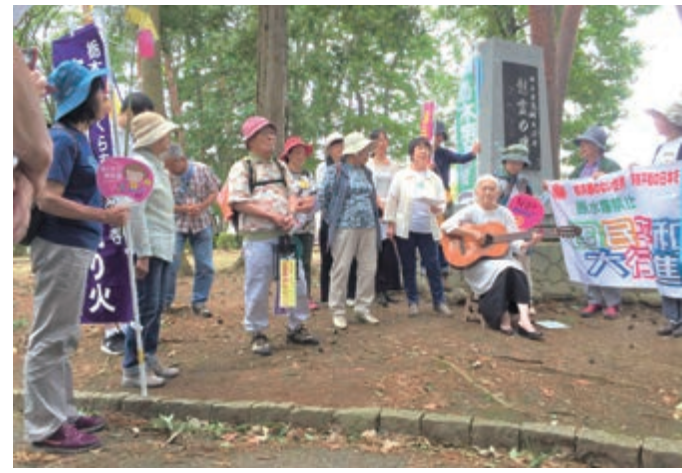
慰霊のうたこえが響く

7月8日の行進では、総合運動公園内にある栃木県原爆慰霊碑を訪ねました。碑の前で若い世代や子育て中の母親が詩の朗読を行い、「ヒロシマ・ナガサキを忘れない」誓いを新たにしました。全員で平和の歌を緑の林