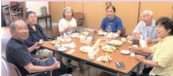
みんなでパタカラ体操をしました

矢板班 「むせやすい」「口の乾燥が気になる」は、オーラルフレイルの兆候です。パタカラ体操や唾液腺マッサージをした後の食事は、唾液がよく出て喉の通りが良かったです。(7月27日)