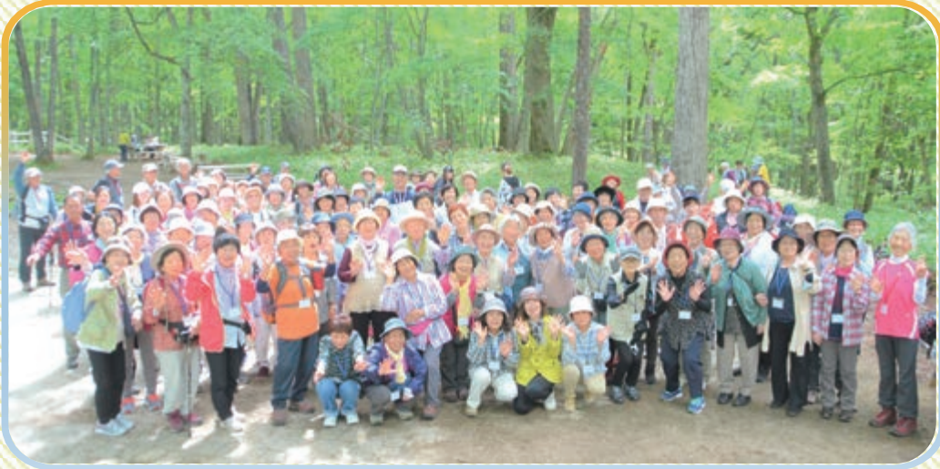
光徳牧場からスタートしました

参加者は「とても楽しかった」「去年来られなくてずっと楽しみにしていた、歩いてとても嬉しい」と大満足の様子でした。