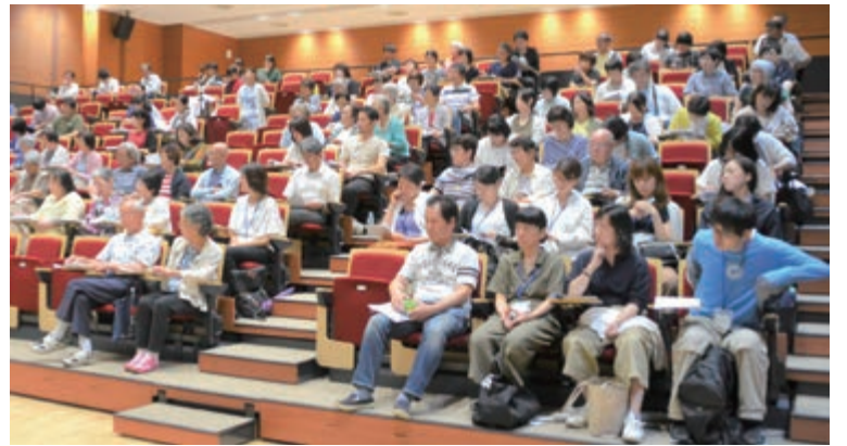
熱心に話を聴く参加者（済生会みやのわホールにて）

社従業員からの相談を受け、 1000億円の私財を投じ て月旅行を計画しているそ の会社の社長とインターネッ ト上で公開の交渉を行い、 2500人の非正規労働者 の時給を一律1000円か ら1300円に引き上げさ せました。すると、その会 社の周辺の企業も時給アッ