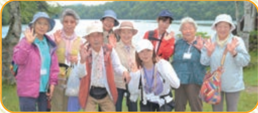
湯ノ湖を背にして