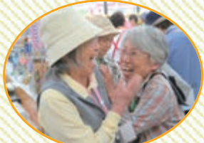
思い出とお土産をお持ち帰り