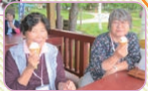
つめたくておいしいソフトクリームで休憩