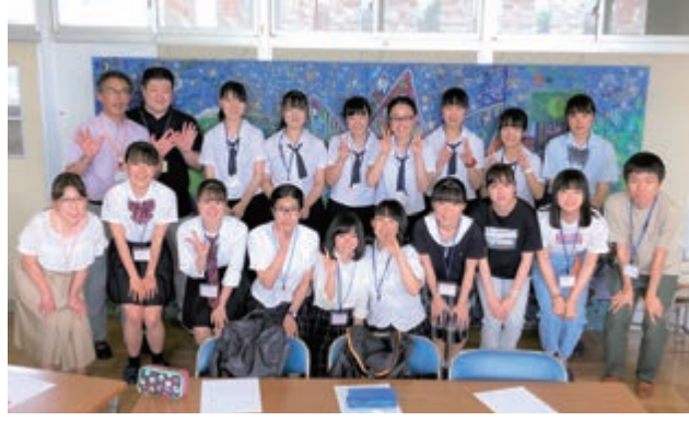
25日はボランティアの高校生最多の15人参加でした

7月24〜26日に西が岡小学校の学習企画に協力しました。ボランティアの高校生ら25人が参加し、小学生に向けて勉強のアドバイスをしました。「一生懸命勉強する小学生と一緒に充実した時間を過ごせてとても楽しかった。」「教えて分かってもらえるところうれしかった。」「分かりやすく説明することの難しさを感じ