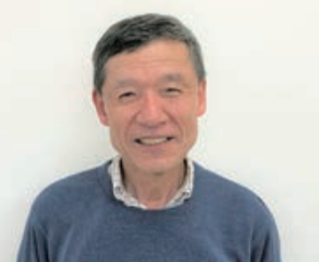
「いきいき活動」に食事会の様子が掲載されています

福島県会津若松市出身です。地元は山に囲まれた盆地で、農家の3姉兄の末っ子として育ちました。高校卒業後、電気関係の会社への就職を機に矢板へ引っ越ししました。 趣味はランニングです。勤めていた会社が市のマラソン大会に協賛しており、参加を勧められたことがきっかけです。飲酒喫煙もしますが、ランニングはもう10年続けています。腰痛を感じなくなり、風邪をひかなくなりました。 くろいそ班では班長を務めています。主に食事会を実施して、孤食を防いだり、オーラルフレイル予防に役立ったりと、健康に良い影響があると感じています。みんな自由に楽しく参加している姿が何よりうれしいです。