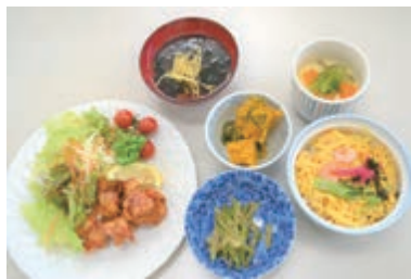
ちらし寿司やからあげなど 美味しいメニュー

健康チェック(東) コープ越戸店で健康チェックを実施しました。毎月第2金曜日13時半〜15時、年金支給の月は支給日に実施。8月はお盆のため9日に行います。(6/14)